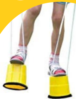
SPAINĪŠU ŅEKATAS (3 - 7 GADI)