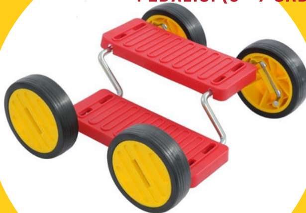
PEDĀLĪŠI (3 - 7 GADI)