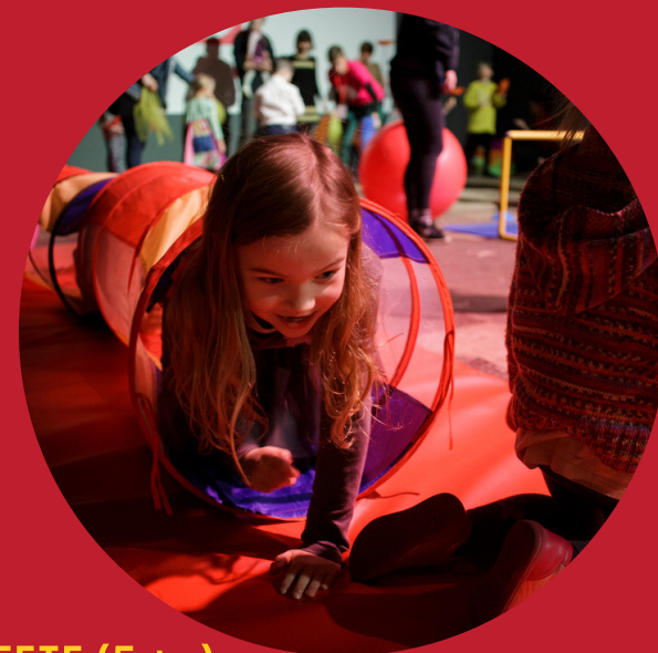
STAFETE (5 + -)