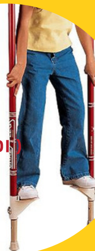
ŅEKATAS (7+ GADI)